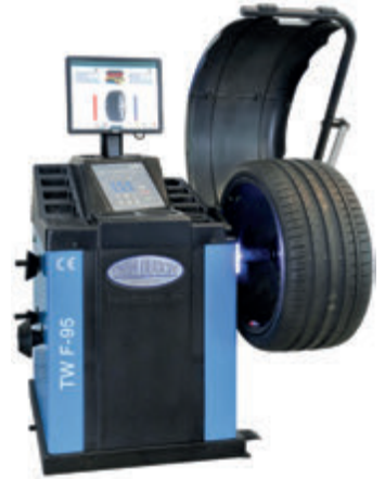
Tasapainotuskone automaattinen: TWF-95

Automaattisessa tasapainotuskoneessa on sekä sisäpuolinen, elektroninen mittavarsi sekä ulkopuolinen mittavarsi, jotka määrittävät vanteen koon. Lisäksi kone on varustettu useilla käyttöä helpottavilla ominaisuuksilla kuten suuremmalla näyttöllä, led-valaistuksella sekä laserosoittimella, joka helpottaa painon kiinnittämistä oikeaan paikkaan. Koneessa on leveille vanteille sopiva 255 mm tasapainotus akseli.