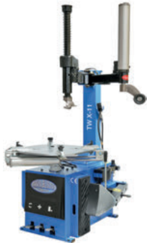
Rengaskone apuvarrella: TWX-11

Puoliautomaattisessa rengaskoneessa puolestaan asennuspään siirtäminen tapahtuu manuaalisesti jousikuormalla ja kallistus on paineilmatoinen. Kone on varustettu apuvarrella, joka helpottaa renkaiden irrotusta. Puoliautomaattista konetta voidaan suositella korjaamoille, joilla asennustarvetta on säännöllisesti.