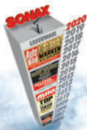
Sonax on jälleen valittu parhaaksi brandiksi 2020

SONAX XTREME Foam + Seal on tehokas vaahtopinnoite, joka suojaa auton maalipintaa tehokkaasti ja antaa sille upean helmiäiskiillon sekä vettä ja likaa hylkivän efektin. Vaahdotin avulla pinnoitteen levitys sujuu nopeasti ja tasaisesti. Foam + Seal onkin loistovalinta talven ylläpitosuojaksi, sillä vaivaton tuote tarjoaa upean lopputuloksen hetkessä. Myydään riittoisassa 1 litran pullossa.