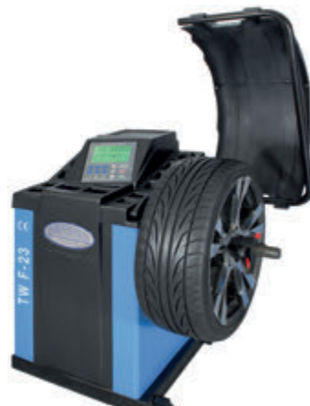
Tasapainotuskone semi-auto: TWF-23

Puoliautomaattisissa tasapainotuskoneissa on yleensä sisäpuolinen elektroninen mittavarsi, jonka avulla saadaan syötettyä vanteen halkaisija ja etäisyydet, mikä sujuvoittaa työskentelyä. Twin Buschin semi-automaattisessa koneessa on leveille vanteille sopiva 255 mm tasapainotus akseli.